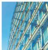
rehabilitación de viviendas

TECONSA GLOBAL intenta ofrecer los precios más competitivos en todas sus contrataciones, ajustándolas a la calidad demandada en cada proyecto y con la flexibilidad necesaria para realizar cuantas modificaciones sean necesarias para satisfacer a nuestros clientes.