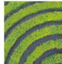
mantenimiento de jardines limpiezas y desbrozados limpieza de piscinas

Carretera de Martorell, 98-100, nave 2 08740 Sant Andreu de la Barca