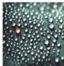
impermeabilizaciones terrazas, cubiertas y goteras trabajos con garantía