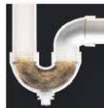
Rehabilitación de baños