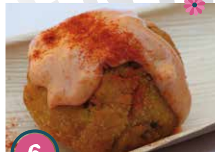
Bar donde siempre Salmorejo de formatge amb encenalls