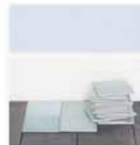
reformas integrales llaves en mano