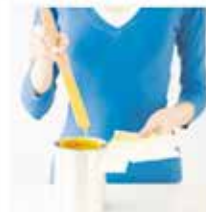
trabajos de pintura pintado de escaleras patios de luces