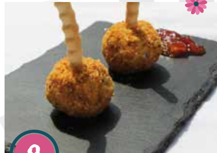
El rei dels frankfurt's Pollastre cajun a l'estil de Louisiana