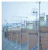
Rehabilitación escalera comunitaria