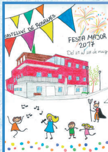
Finalista Alba Paneque