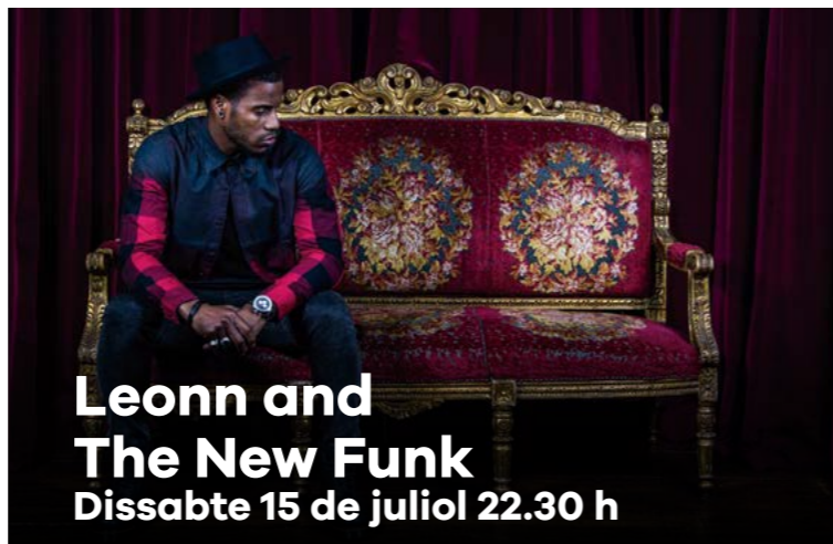
Leonn and The New Funk Dissabte 15 de juliol 22.30 h