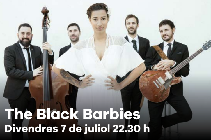
The Black Barbies Divendres 7 de juliol 22.30 h