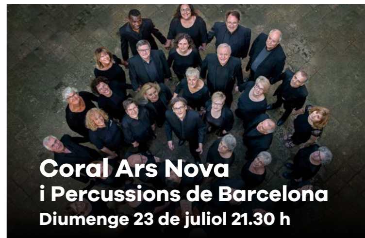
Coral Ars Nova i Percussions de Barcelona Diumenge 23 de juliol 21.30 h