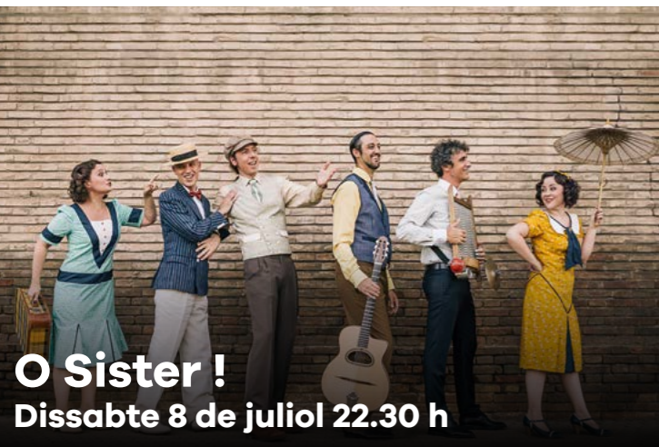
O Sister ! Dissabte 8 de juliol 22.30 h