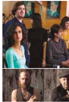
Dissabte 14, 19 h Concert: El pèsol feréstec + TRexmania + Sibaris Just for one day. Tribut a David Bowie (folk + pop)