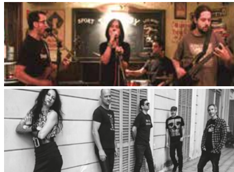
Dissabte 21, 20 h The Tantum n'Quantum + Despreciables Tributo a Desechables (rock)