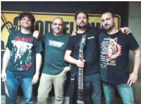
Divendres 20, 20 h Goodfellows (pop) i White Hounds (rock)