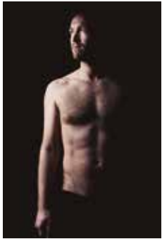
Divendres 6, 20 h Delafé + La Bien Querida (poesia / pop d'autor)