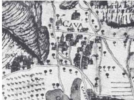
Plànol de la Baronia de l'Eramprunyà, 1590, on es veu el nucli de la Roca Museu de Gavà

Dita popular: A la Roca el sol hi toca, és la flor dels mariners.