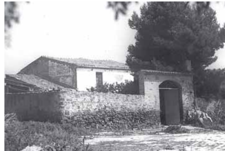
El mas de l'Horta, cap a 1970

El mas de l'Horta, encarat a migdia i dominant la plana del delta, és una casa de planta baixa i primer pis, sense golfes. Cal remarcar les llindes i els brancals de pedra, el rellotge de sol i el ràfec de la coberta. Ha passat per diverses reformes i addicions.