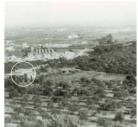
Can Ribes, 1966

Dita popular: A Can Ribes... no hi arribes