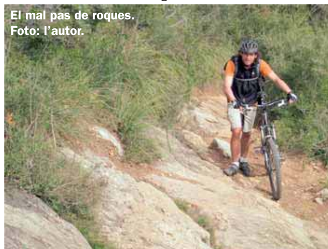
El mal pas de roques.