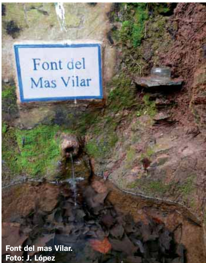
Font del mas Vilar.

La font és al final d'una petita mina excavada a la terra que recull l'aigua filtrada al turó de Rocabruna. Per la forma constructiva, va ser oberta a finals del segle XVIII, i la font restaurada el 1936. Als anys vuitanta havia quedat colgada de fang i terra, fins que al llarg del 2009 els voluntaris del Grup Ecologista Quercus i la Unió Muntanyenca Eramprunyà la van trobar, netejar i condicionar, per donar el magnífic aspecte que té avui en dia. La placa amb el nom de la font va ser iniciativa de l'Escola de Ceràmica de Gavà. A l'altra banda de la riera encara es pot veure una placa amb lletres blaves de disseny noucentista datada l'any 1924, que convida a respectar l'indret.