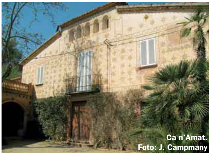
Ca n' Amat. Foto: J. Campmany

L'any 1898, el propietari del mas va aixecar diverses cases amb apartaments, destinades a famílies barcelonines que hi venien a estiuejar. El conjunt va passar a denominar-se Colònia Amat i, als anys vint, era un dels indrets d'estiueig més selectes de la burgesia barcelonina. El 1914 s'hi va construir una pista de tennis -el primer equipament esportiu de Gavà- i poc després un minigolf, les restes del qual es poden veure a una banda de l'esplanada central.