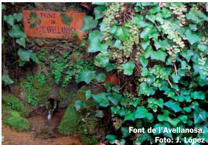
Font de l'Avellanosa.

esquerra, una rajola ens indica que estem al costat de la font de l'Avellanosa. S'hi accedeix baixant unes escales artesanals amb un passamà de fusta. La font va ser restaurada l'any 2007 pels voluntaris del Grup Ecologista Quercus.