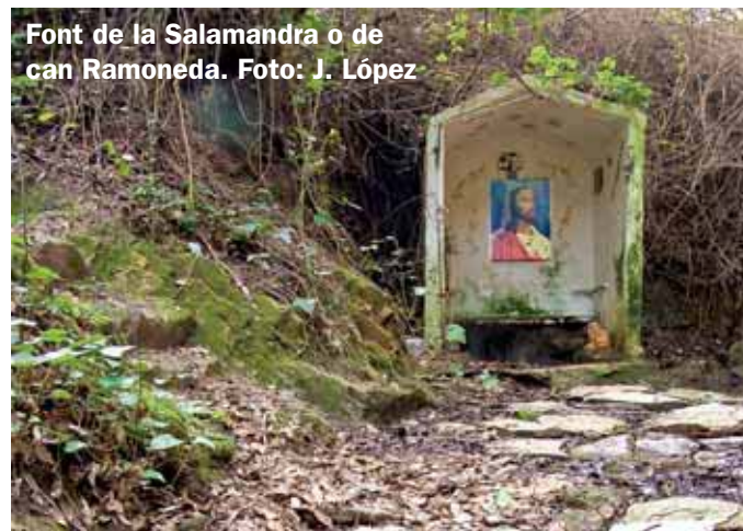
Font de la Salamandra o de can Ramoneda.