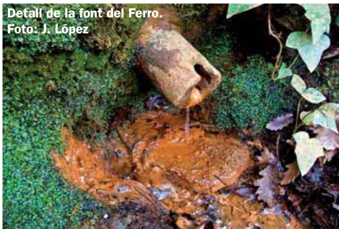
Detall de la font del Ferro.