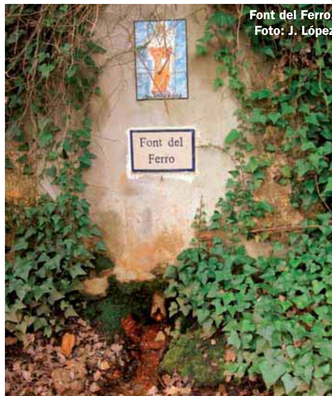
Font del Ferro.

Fem un tastet i continuem per un senderó que surt de davant la font, que desemboca a la pista principal (sender GR-92). La seguim tot fent un gir a l'esquerra.