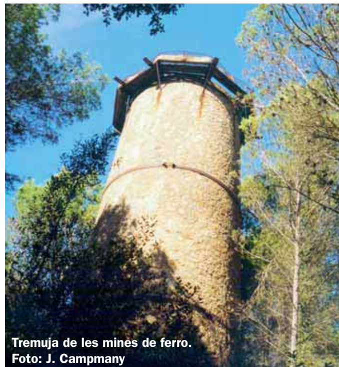
Tremuja de les mines de ferro.

3,810 Anem baixat i, al cap de pocs metres, travessem una riera. A mà 1:10 119