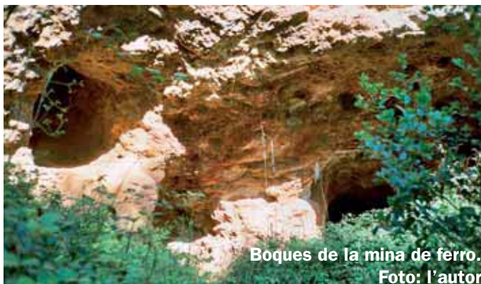
Boques de la mina de ferro.