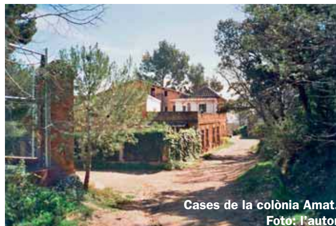
Cases de la colònia Amat.