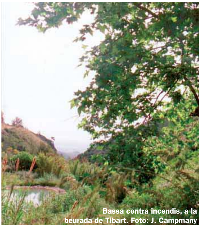
Bassa contra incendis, a la beurada de Tibart.

Tibart era el nom de la muntanya que acabem d'abandonar (avui serra de can Perers), i l'abeurada satisfieia la set dels ramats que temps enrere transitaven per aquestes muntanyes.