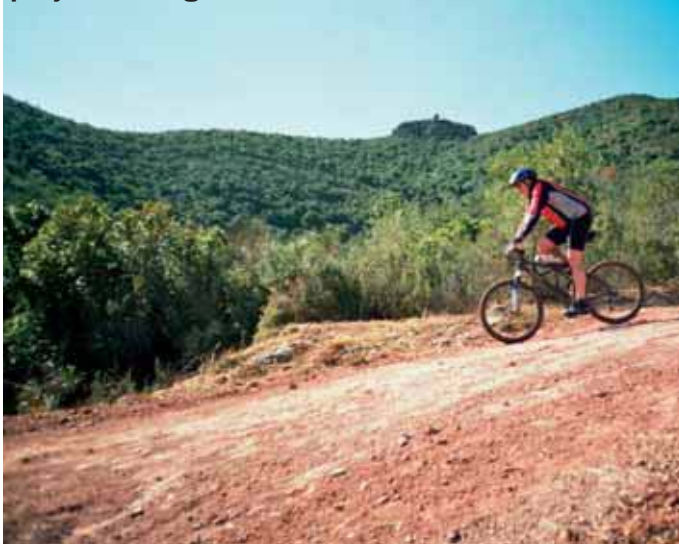
Pujada dels Penitents. Al fons, les penyes de l'Àliga.