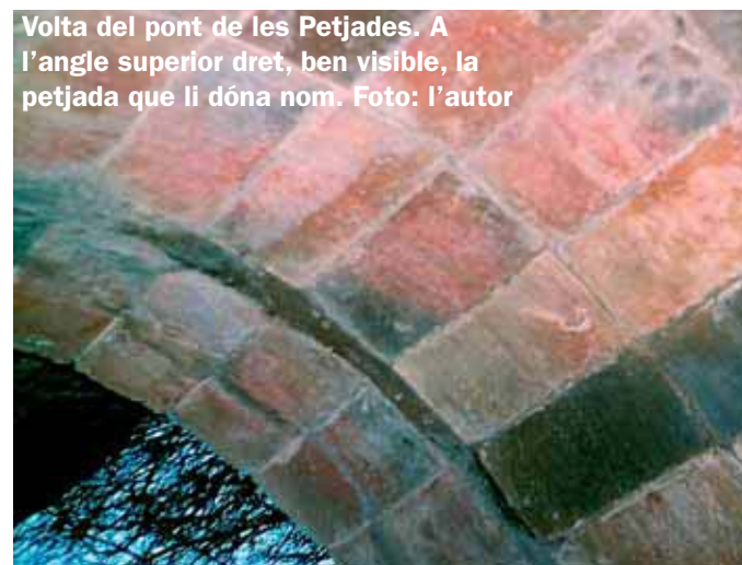
Volta del pont de les Petjades. A l'angle superior dret, ben visible, la petjada que li dóna nom.

Després d'observar aquestes curioses petjades i seguint el camí ens trobem a l'esquerra una glorieta de ciment armat, bastant malmesa.