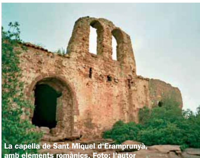
La capella de Sant Miquel d'Eramprunyà, amb elements romànics.

Seguim recte pel GR-92 (hi ha indicadors verds de ferro). Al cap de poc, i amb pendent bastant acusada, ens trobem al castell d'Eramprunyà i er-