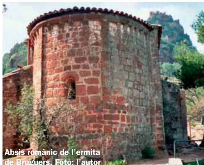
Absis romànic de l'ermita de Bruguers.

0,000 Sortida: plaça de l'ermita de Bruguers. Cal preveure que l'arribada serà en un altre lloc. L'ermita està conformada per dues parts diferenciades. L'absis és romànic, del segle XIII, i formava part d'un petit oratori de camí. La façana i la nau corresponen a una ampliació de principis del segle XVI, inaugurada el 15 de juny de 1509. L'absis romànic té part de les típiques decoracions llombardes, però manca d'arcuacions. Possiblement van ser eliminades durant la reforma del segle XVI, ja que està documentat que durant les obres va caure la volta de l'ermita. 0:00 68