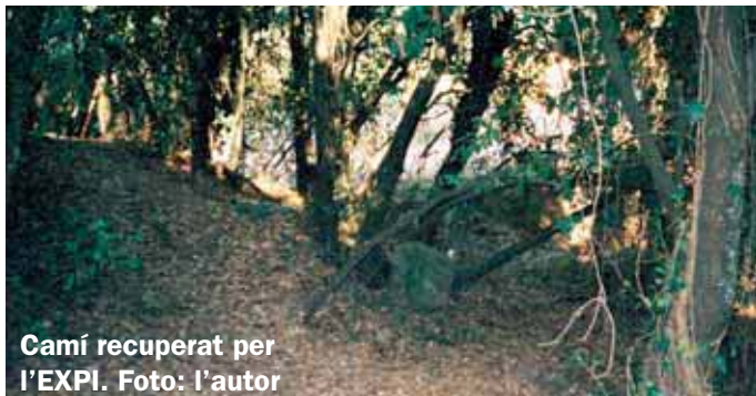
Camí recuperat per l'EXPI.

vant nostre i en una curta, perillosa i forta baixada, comença un caminet que seguim amb molt de compte. Anem trobant senyals discrets de color groc a les pedres i alguna als arbres. Els hem d'anar seguint. El caminet té uns 300 m de forta baixada al principi, però és més bonic del que us podeu imaginar, amb molta vegetació d'alzinar, galzeran, arboç i alguna espècie més. A part d'això, també és molt frescal, tot i que una mica perillós a causa de la fullaraca del terra que, com que és humida, el fa un xic relliscós. El camí ha estat recuperat per l'Associació Esportiva EXPI de Gavà, ja que feia molts anys que no s'hi passava i estava tot taponat. Arribem al final d'aquest camí i ens trobem amb una pista que és el sender PR-39.