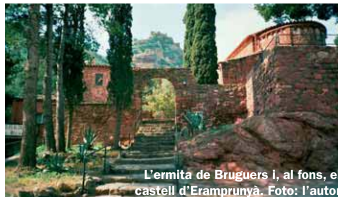
L'ermita de Bruguers i, al fons, el castell d'Eramprunyà.