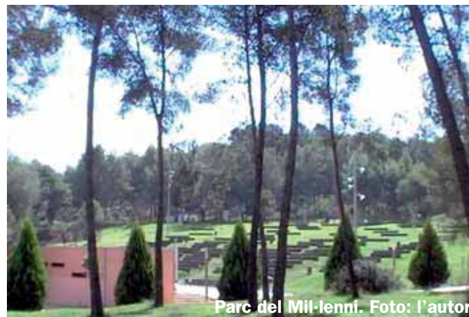
Parc del Mil·lenni.