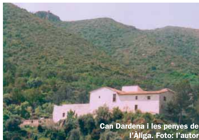
Can Dardena i les penyes de l'Àliga.