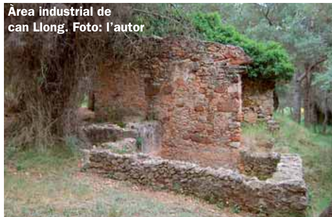
Àrea industrial de can Llong.