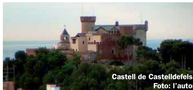
Castell de Castelldefels.

L'església de Santa Maria, al costat de llevant, és l'origen real del castell. Ja esmentada en documents del segle X, en aquella època era la seu d'un monestir benedictí sotmès a Sant Cugat del Vallès. Sota l'església s'han descobert ruïnes romanes (hi ha una inscripció conservada que ens esmenta el seu probable propietari), i, per sota del nivell romà, restes d'un poblat ibèric. L'església fou refeta al segle XI, en època del romànic, i hi correspon la major part de l'edifici actual. Va ser objecte d'ampliacions als segles XVI i XVIII, i durant la guerra d'Espanya va ser utilitzada com a presó per a brigadistes internacionals sancionats. És interessant vi-