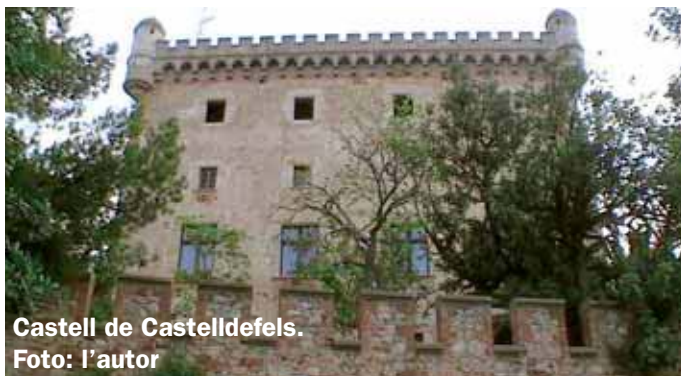
Castell de Castelldefels.

sitar-ne l'interior, on hi ha una petita exposició de la història de l'edifici i del castell annex. Cal arranjar la visita anticipadament a l'Ajuntament de Castelldefels, propietari del conjunt.