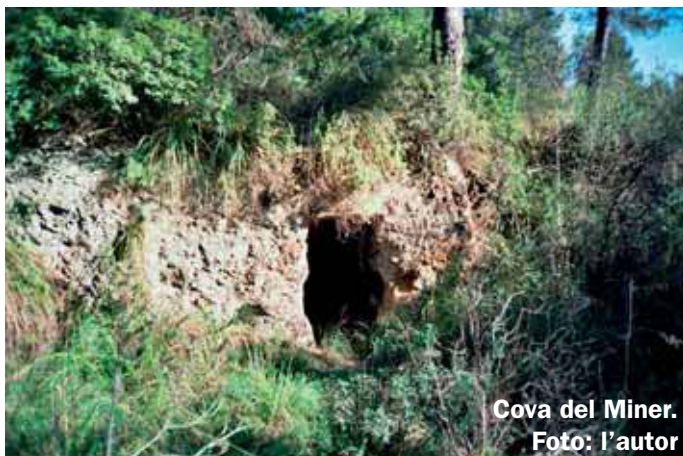
Cova del Miner.

camí que desemboca a la nostra dreta, però no n'hem de fer cas. Al cap de poca estona en trobem un altre que fa un gir a la dreta molt pronunciat, de gairebé 180°, que seguim.