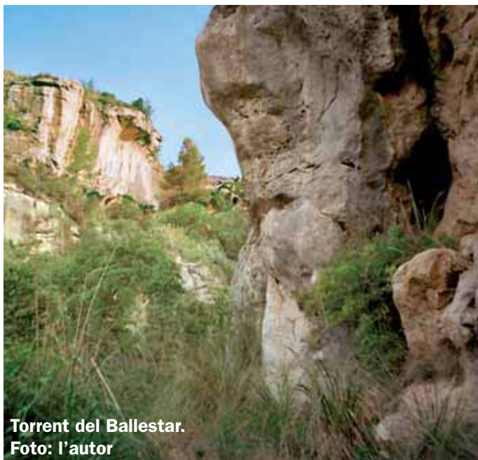
Torrent del Ballestar.