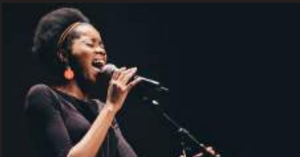
20 de juliol 22.30 h Flore M