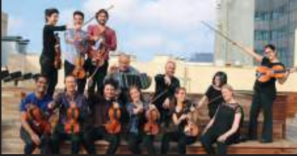
5 de juliol 22.30 h Orquesta del Reial Cercle Artístic de Barcelona