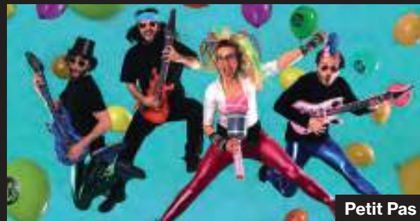
20 de juliol 20.00 h Xics'n'Roll Band