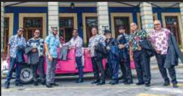
19 de juliol 22.30 h Grupo Compay Segundo