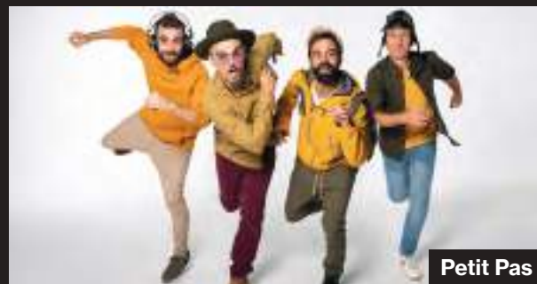
13 de juliol 20.00 h Xiula